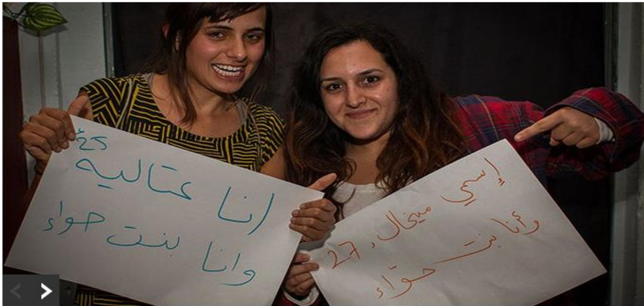
אירוע פתיחת שנת הפעילות של "וואחד על אחד".

בעוד מהומות אלימות וגילויי גזענות ממלאים את כותרות העיתונים, בתל אביב ממשיכים לפעול ארגונים ויוזמות למען דו קיום ושוויון