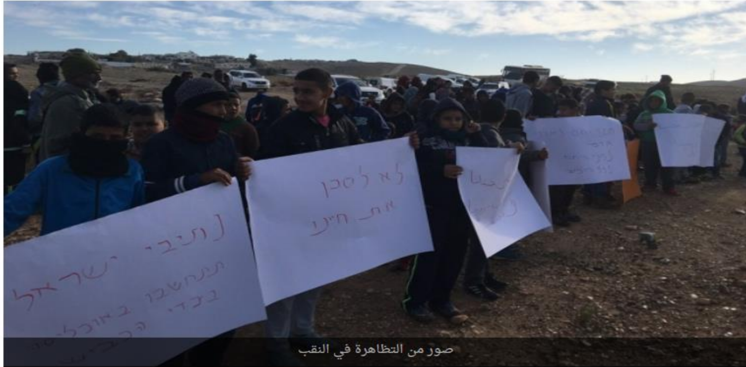
صور من التظاهرة في النقب

تاريخ النشر: 10/01/2016 - آخر تحديث: 12:24