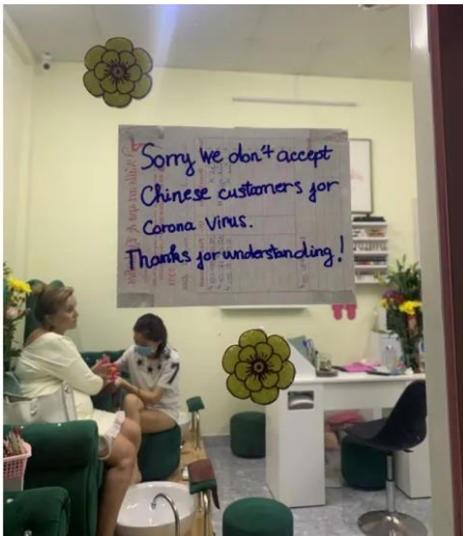
צילום מסך מתוך אתר האינטרנט של 'הארץ'